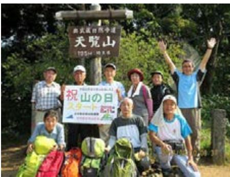
天覧山 飯能勤労者山岳会 / 埼玉