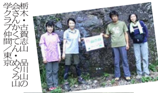
栃木・古賀志山 会さんかてん・品川山の 学クラブ仲間 / 東京 めぐろ山