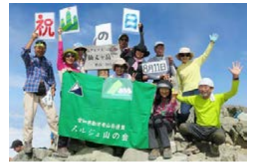
高御位山 高御位山遊会 / 兵庫