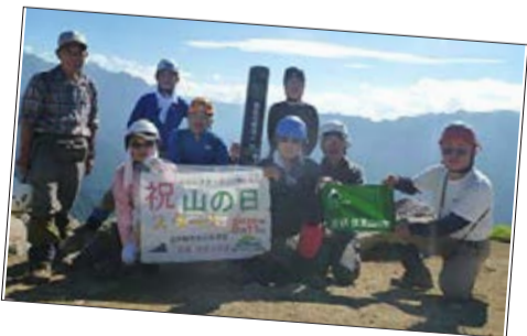
焼岳 岳会 / 京都 伏見勤労者山