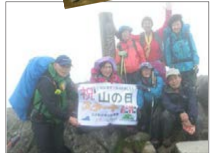
トムラウシ山 大田H C / 東京