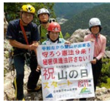
京都金比羅山 明峯勤労者山岳会 / 京都