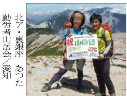
北ア・裏銀座 勤労者山岳会 / 愛知 あつた