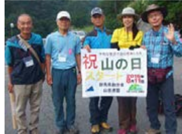
桂木山 コンパス / 山口