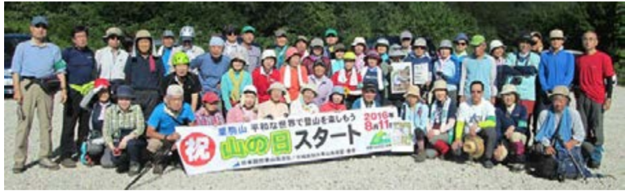
栗駒山 東北・奥羽ブロック