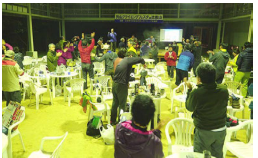
ギターの生演奏で盛り上がった交流会