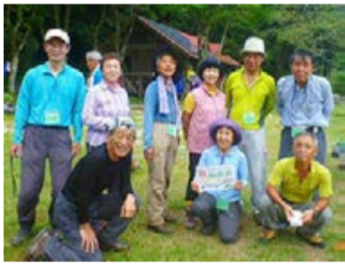
宝満山 R K A C / 福岡