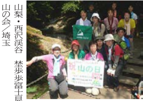
山梨・西沢溪谷 山の会 / 埼玉 桝歩富士見