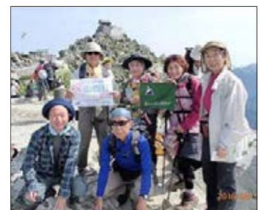
立山 富山H C / 富山