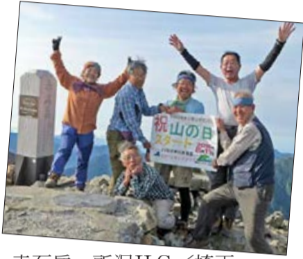
赤石岳 所沢H C / 埼玉