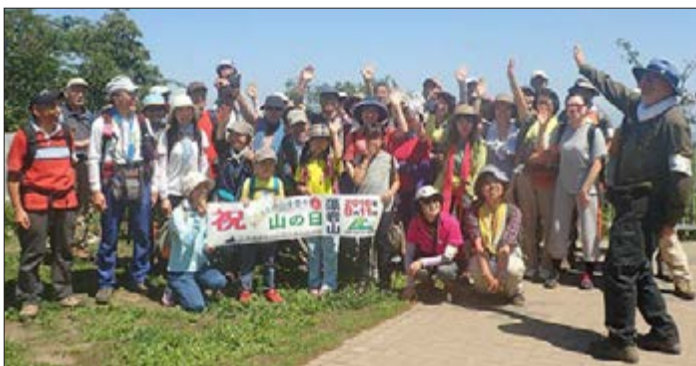
札幌・藻岩山 北海道・道央連盟

今年2016年8月11日、国民の祝日である「山の日」がスタートしました。「山の日」は、私たちが山の恵みに感謝し、美しく豊かな自然を守り、そして次世代に引き継いでいかねばならないことを考える日です。この日を祝して、全国各地での記念式典をはじめ、全国各地でさまざまなイベントが行われましたが、山の仲間たちは各地の山に登り、写真を撮って送ってくれました。みんないい顔してますね。