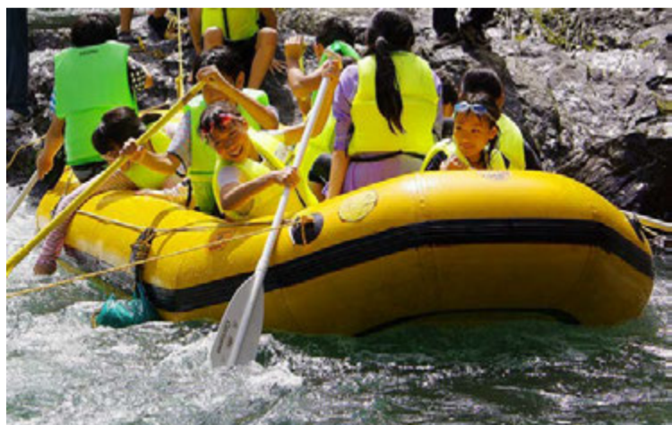
ゴムボートに乗る子どもたちの顔は輝いていた

福島県南相馬市内の小学生20人を招待し、のびのびと野外で遊ばせるプロジェクト「福島の子どもたちと夏休み」が、労山静岡県連主催により8月2~4日に、静岡県島田市川根町の「市山村都市交流センターささま」で開催されました。野、神奈川県での開催につぐ3年目です。